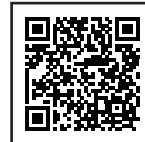
違反対象物公表制度